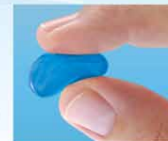
FLUIDE SENSITIV GEL

Die einzigartige, dreidimensionale Anpassungsfähigkeit des GEL-Systemkerns garantiert optimale Elastizität und Druckentlastung.